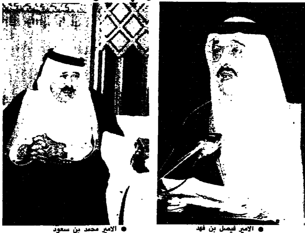
الأمير فيصل بن فهد